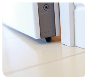
遮音扉 (下部エアタイト)