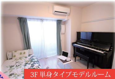
3F 単身タイプモデルルーム