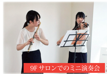
9F サロンでのミニ演奏会